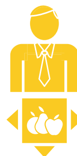
5. Ferme mici diversificate

Acesta reprezintă cel mai prosper grup; sunt prezenți fermieri relativ în vârstă și cu tradiție în activitatea agricolă; utilizează forță de muncă angajată; accesează piețele prin cooperative; investesc în certificări ale producției sau a produselor.