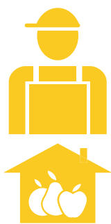
1. Ferme mici implicate în parțial agricultură*

Pentru aceștia, agricultura este o activitate secundară, ce completează alte surse de venit; este realizată în general de fermierii tineri, care au început să facă agricultură din proprie inițiativă; mare parte din producție rămâne în cadrul gospodăriei.